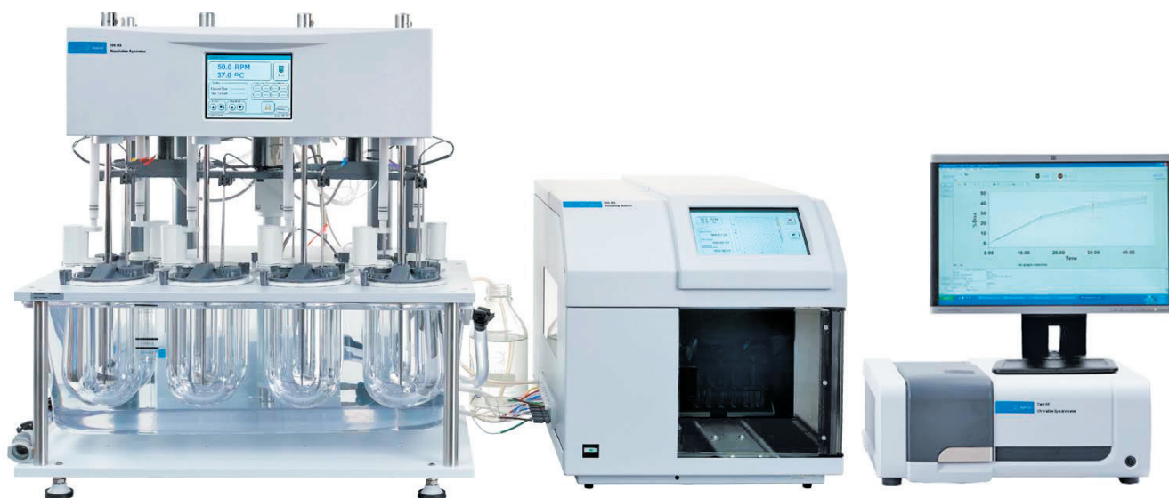
Рис. 1. Система Agilent для дослідження розчинення лікарської форми у складі: тестер розчинення Agilent 708-DS, станція пробовідбору 850-DS та спектрофотометр Cary 60 UV-Vis

Тест «Розчинення» є одним з ключових методів визначення характеристик твердих лікарських форм. Дані про розчинення in vitro дуже важливі в процесі розробки фармацевтичних препаратів (R&D) для забезпечення відповідності генерика препарату порівняння, а також контролю виробництва і якості кожної партії.