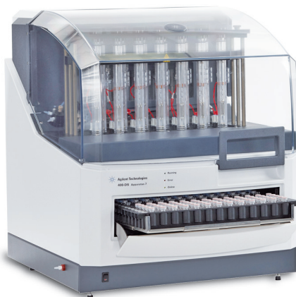
Рис. 3. Agilent 400-DS Dissolution Apparatus із вбудованою станцією пробовідбору та штативом для віал ВЕРХ

Прилад Agilent BIO-DIS (рис. 2) з циліндром, що коливається (USP Apparatus 3), зазвичай використовують для кишковорозчинних лікарських форм з пролонгованим вивільненням, а також для капсул або гранул. Він складається з шести рядів посудин, у яких моделюють вивільнення субстанції в різних відділах травного тракту. Лікарську форму поміщають у скляний циліндр, який із заданою циклічністю піднімається і опускається в посудину із середовищем. Згодом весь ряд циліндрів переміщується далі, до посудин з іншим значенням рН, імітуючи проход-